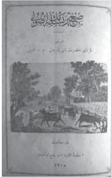
Sığır Beslemek Usulü

1. "Asya-yi Vustaya" ("İstanbuldan Asya-yi Vustaya Seyahat") eseri. "Seyahatname"de Emin Bey yazıyor: " Bendeniz Rusya, Almanya, İtalya, Fransa, İngiltere'yi birçok gezdim ". 39 Başka bir yerde ise: "...Asya-yi Vusta'ya bir değil iki seyahat yaptım'der. 40 Özellikle Türkmenlere meftun olan yazar, onların yaşamı, maneviyatı, ahlakı hakkında oldukça değerli bilgiler vermektedir. Bu bilgi çağımızın okurları için özellikle kıymetlidir. Mesela, Ermenilerin Türkmenlerin ahlakına olumsuz etkisi dolayınca böyle yazıyor: " Asıl Türkmenlerde yalan söylemek ve adam aldatmak malum bile olmadığı halde bu sevahil halkı ermenilerden bi-t-tahsil, gayet firib-ger (yalancı) ve hud'a-perver (aldatıcı) olmuşlardır ". 41 "Teke Türkmenleri" bölümünde o, bildiriyor: " Selçukların aslı